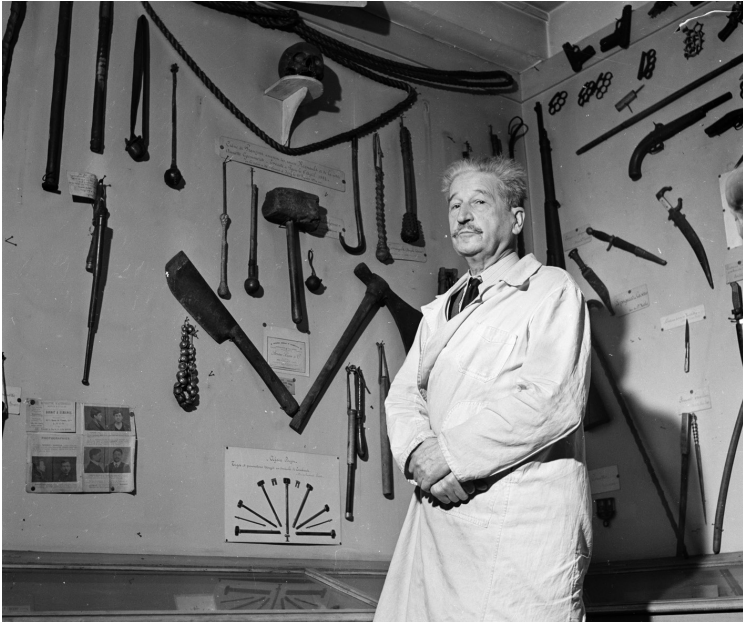
Edmond Locard, der das erste Labor für Ermittlungen am Tatort eröffnete, prägte auch das Motto der Kriminaltechniker: »Jeder Kontakt hinterlässt eine Spur«

ermittler und anderer forensischer Spezialisten zustande, Menschen, die Beweise suchen, sie auswerten und schließlich vor Gericht vorlegen. Den Weg solchen Beweismaterials werden wir in diesem Buch verfolgen.